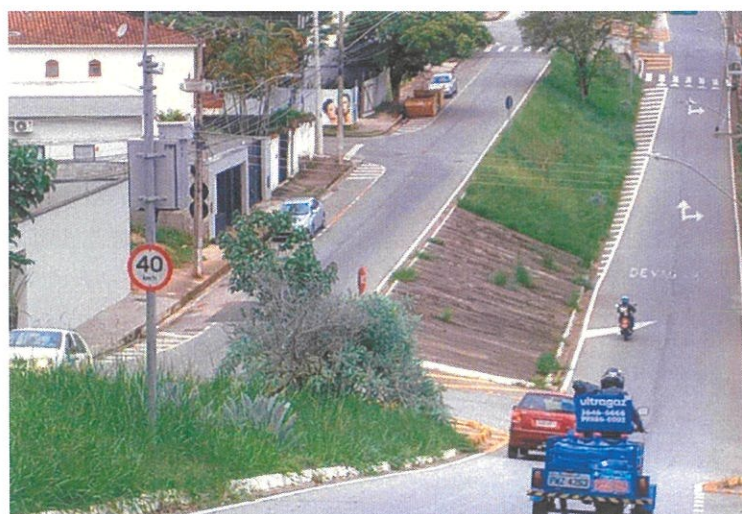
Vista do local.