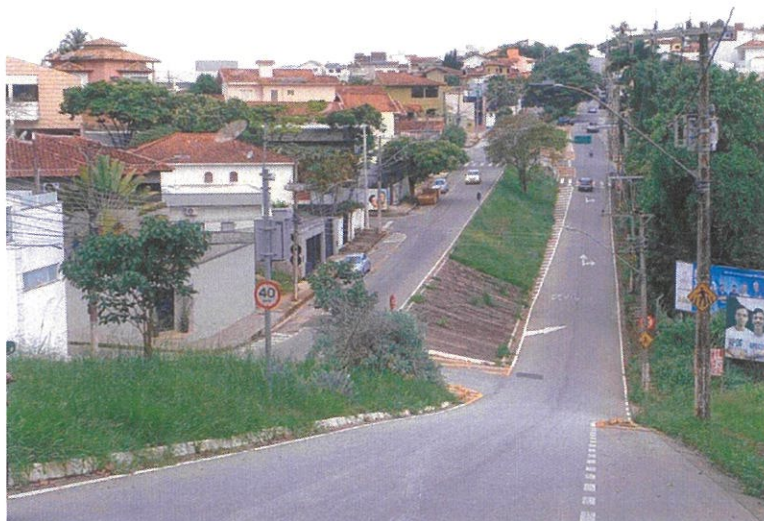
Vista do local.